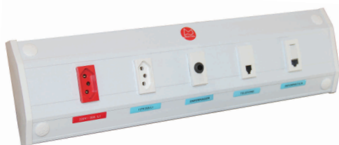
Painel com tomadas elétricas 110/220V, chamada de enfermeira, telefone e rede/internet

Fabricados com exclusivos perfis de alumínio tratados e anodizados ou pintura epóxi a pó. Design arrojado e moderno, acabamento esmerado, possui cantos arredondados, sendo facilmente instalados em qualquer tipo de parede, conforme as necessidades do Hospital. Tubulação interna de nylon em cores padronizadas para os gases. Tomadas elétricas, saídas RJ 45 (rede-internet) e RJ 11 (telefone) chamada de enfermeira e interruptores de iluminação. Assistência Técnica permanente.